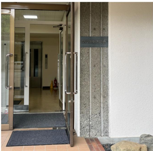
表札の取付イメージ

大学正門前の坂道を上って左に折れた通りの一筋向こう側に聖心侍女修道会の本部がありますが、大学構内にあった修道院のほうは、正式には「五反田第二修道院」という名称で、この建物は1979年に建設され、2021年4月末から大学の所有となっています。