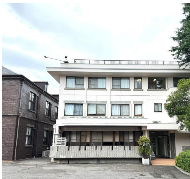
5号館（旧修道院）（2025年6月12日撮影）

5号館入口右側上方に「聖心侍女修道会」の表札が設置されていた、その痕跡が確認できます。