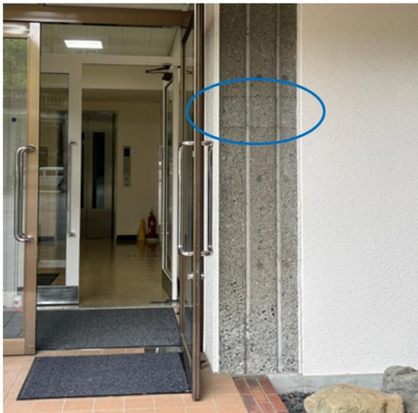
5号館入口（青枠内が表札跡）

5号館入口右側上方に「聖心侍女修道会」の表札が設置されていた、その痕跡が確認できます。