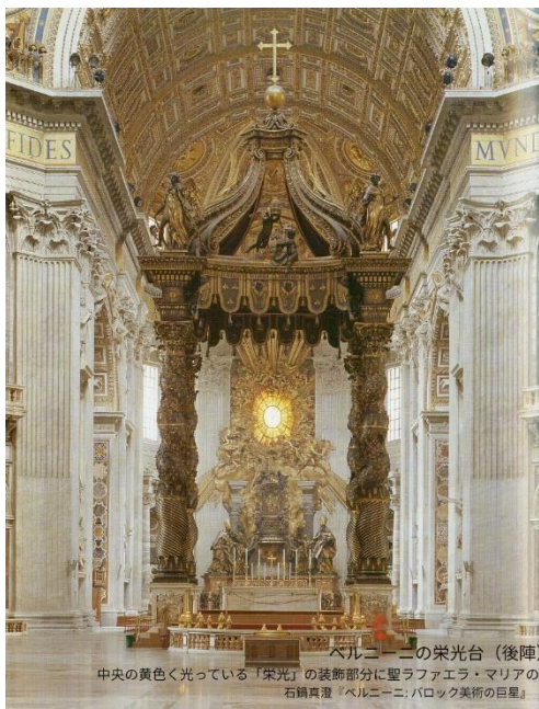
ベルニーニの栄光台（後陣）とブロンズの天蓋 中央の黄色く光っている「栄光」の装飾部分に聖ラファエラ・マリアの肖像画が掲げられました 石橋真澄「ベルニーニ：バロック美術の巨星」（吉川弘文館、2010年）より

の称号を、教皇の印しによって宣言する」と宣言されました。ベールで被われていた「ベルニーニの栄光台（サン・ピエトロ大聖堂のアプシス（後陣）に位置するブロンズの司教座）」に一齐に明りが付き、大聖堂のパイプオルガンがテ・デウム（Te Deum）を奏で、聖歌隊と大群衆が唱和しました。その後、「福者ラファエラ・マリア我らのために祈り給え」と福者に対する最初の祈願が歌われました。