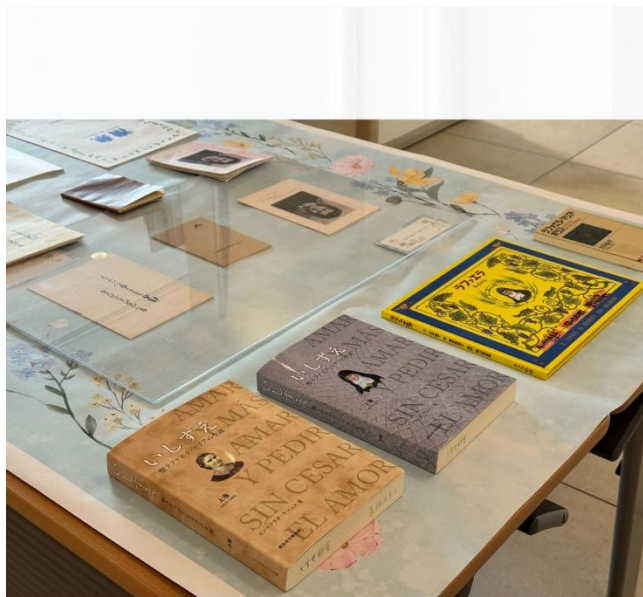
ラファエラについて記された書籍もご紹介！