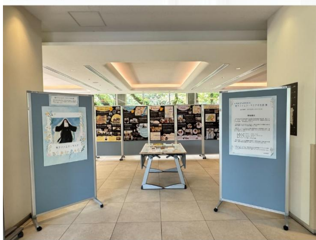
聖ラファエラ・マリアの生涯をまとめたパネル 今年1月のパネル展示から大幅にバージョンアップしています

※「列福」とは、カトリックにおいて、徳ある行為によりその生涯が聖性なものであったことが認められた者に「聖人」に次ぐ「福者」の地位が与えられることをいいます。ラファエラは没後 27 年目の 1952 年 5 月 18 日に「福者」となり、さらに 1977 年 1 月 23 日に「聖人」となりました。