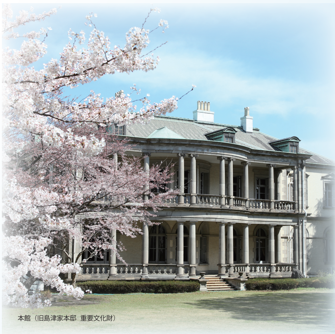
本館（旧島津家本邸 重要文化財）