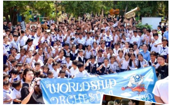
カンボジアの小学校で演奏♪ 多くの子どもたちが熱心に演奏を聴いてくれました

カンボジアでは日本人保育園や現地の小学校、日本カンボジア友好絆フェスティバルで演奏をしました。フィリピンでは学校での演奏に加え、アジア最貧困地区ともいわれるマニラトンド地区のジュニアオーケストラチームと共演し、音楽を通じて彼らと心を通い合わせることができました。コンサートの終演後には楽器体験を実施し、子どもたちに実際に楽器演奏を体験してもらいました。