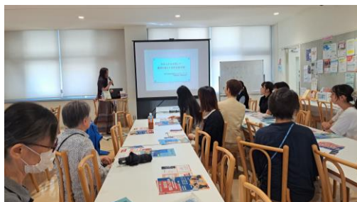
JFCネットワーク勉強会の様子

今までの二十数年の短い人生の中で、大学生活が一番楽しかったと胸を張って言えるほど、清泉女子大学での生活はとても楽しかったです。友人、先輩や後輩、職員の皆さんたちとの交流は、かけがえのない宝物だと思っています。たとえ年齢を重ねても、きっと想い起すのは、鮮やかなツツジの庭で、本館を見上げたこの毎日です。在学生の皆さんにも、清泉女子大学で過ごす日々が、何ものにも代えがたい青春になることを祈っています。