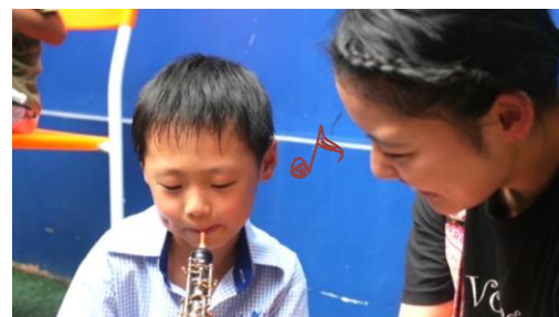
楽器体験♪ 初めて音が出せたときの嬉しそうな表情が印象に残っています