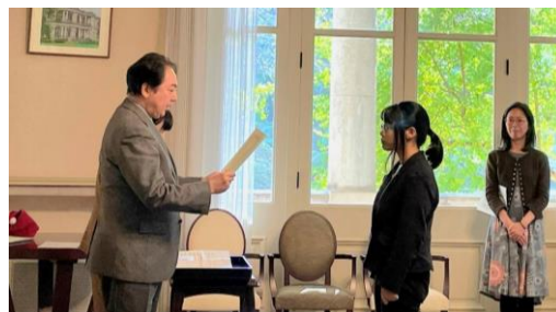
「学業奨励奨学金」授与式の様子