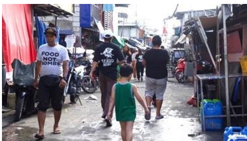
マニラトンドの貧困地区。ここに暮らす子どもたちと一緒に演奏しました

迷いや不安があっても、まずは一步を踏み出してみてください。私自身、異国の地で演奏することに不安もありましたが、実際に子どもたちと音楽を通して心を通わせた時間は、何ものにも代えがたい宝物になりました。たとえ最初は自信がなかったとしても、真摯に向き合い、努力を重ねる中で見えてくるものが必ずあると思います。どうか自分の「やってみたい」を大切に、一步を踏み出してみてください。皆さんのチャレンジを応援しています。